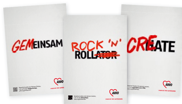
Kampagnenmotive „Markier den Unterschied“

Er reagiert damit auf aktuelle gesellschaftliche Entwicklungen: Der soziale Bereich steht unter wirtschaftlichem und politischem Druck, während Solidarität und gesellschaftlicher Zusammenhalt an Selbstverständlichkeit verlieren. Die AWO setzt dem eine klare Haltung entgegen: Sie ruft auf, sich aktiv einzubringen – durch ehrenamtliche Arbeit, Spenden oder Engagement im Alltag.