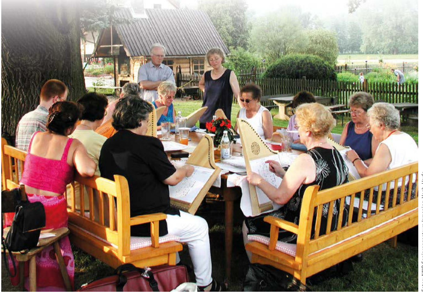
Veeh-Harfe

Einmal pro Woche kommt nun eine Musikpädagogin der örtlichen Musikschule ins AWO Seniorenzentrum Ismaning.